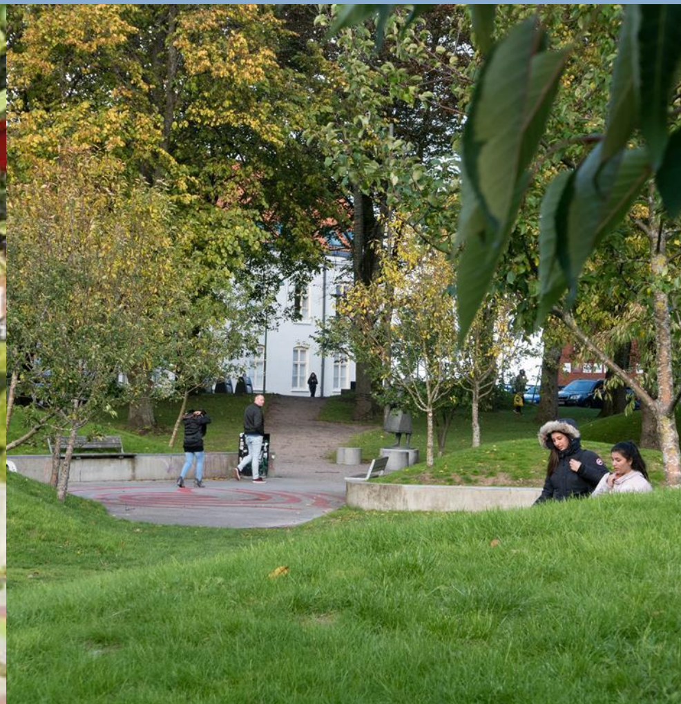
Storhaug, Lervik park, Stavanger