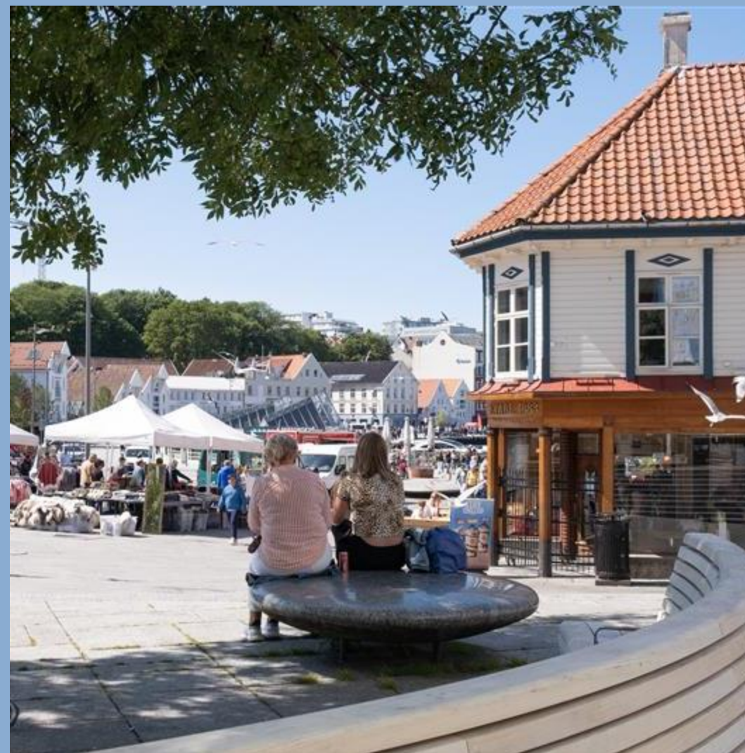
Sølvberget og torget, Stavanger